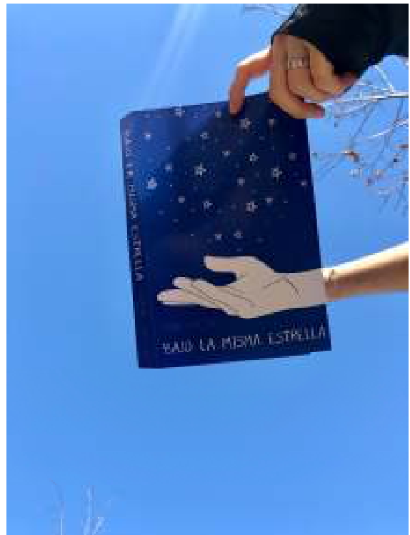
#bookface de No està escrit a les estrelles

Holzer es va inspirar en altre popular joc, #Sleeveface , al que la gent utilitzava portades de discos mítics sobre la seva cara, i el va adaptar al seu propòsit. El resultat va ser tan celebrat que llibreries de tot el món es van sumar a l'iniciativa. De fet, algunes biblioteques públiques de Barcelona acostumen a compartir els divendres a les seves xarxes alguns muntatges.