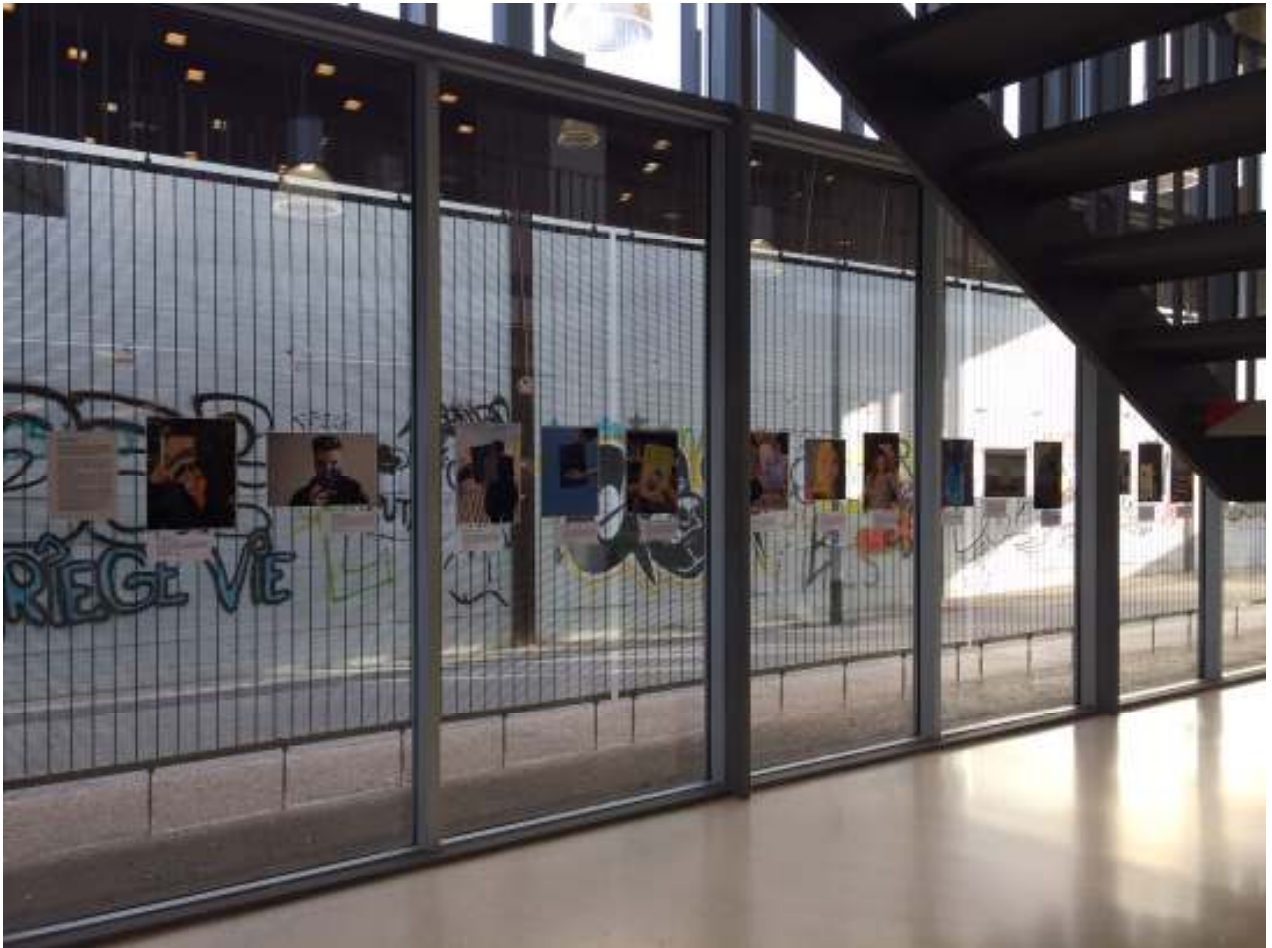
Vista d'una part de l'exposició #bookface a la Biblioteca La Sagrera

L'exposició es podrà visitar fins a finals del mes d'abril. I aprofitant la visita podràs conèixer nous llibres que la biblioteca també té com a préstec.