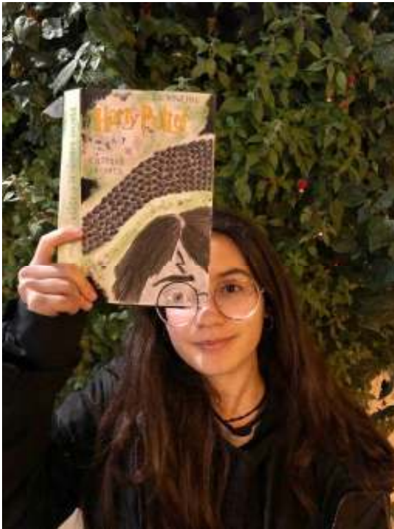
#bookface de Harry Potter

Després de redissenyar la portada de llibres i d'algunes pel·lícules van crear el seu propi #bookface . El resultat ha estat unes atractives i originals fotografies que recomanen els seus títols favorits als usuaris d'aquest espai.