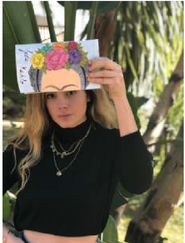
#bookface de Frida Kahlo

Amb les xarxes socials arriben noves maneres creatives per recomanar llibres. Primer van ser els booktubers i ara també el hashtag #BookFace . Com sugereix el terme, el joc consisteix en compartir una fotografia encaixant el rostre (o una altra part) a la portada d'un llibre.