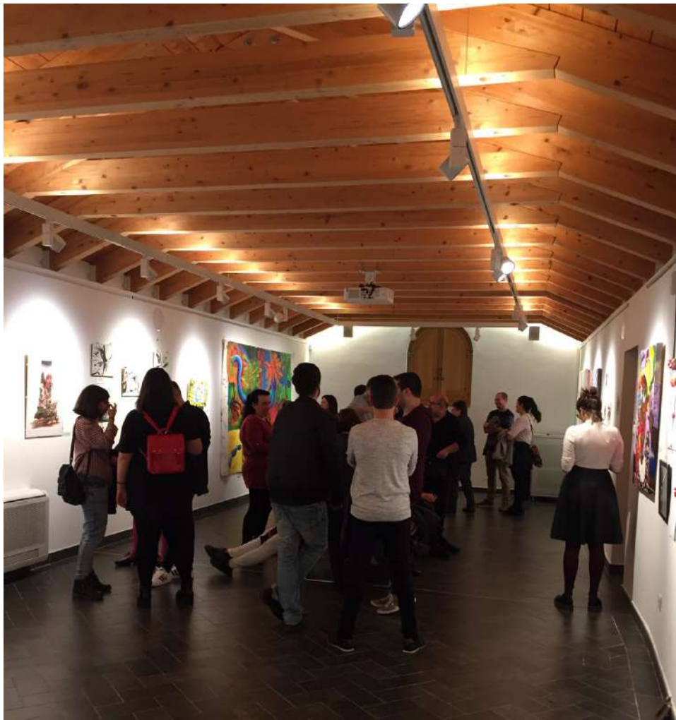
Imatge de l'inauguració a l'espai expositiu Golfes al CC Can Verdaguer