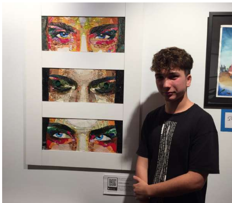
L'Arnau Jalón a la Mostra d'Art

També molts artistes fomenten la realització d'obres d'art amb materials residuals, generant i fomentant un discurs de consciència ecològica a l'àmbit artístic”.